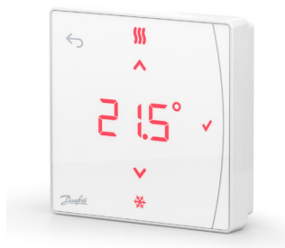
Danfoss Icon2™ RT 088U2121