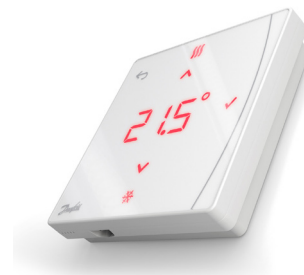
Danfoss Icon2™ Featured RT (IR sensor) 088U2122

Danfoss Icon2™ RT is een serie draadloze thermostaten die de vrijheid biedt om uw thermostaat te plaatsen zonder de beperkingen van draden in de muur. Dankzij het minimalistische ontwerp met een diepte van slechts 16 mm en de automatische uitschakeling heeft het display een elegante uitstraling die volledig opgaat in de omgeving.